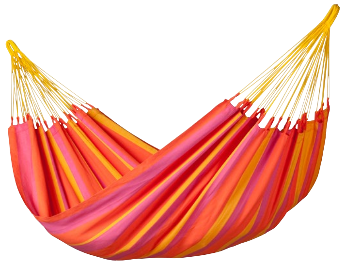
Single-Hängematte Sonrisa mandarine SNH14-5