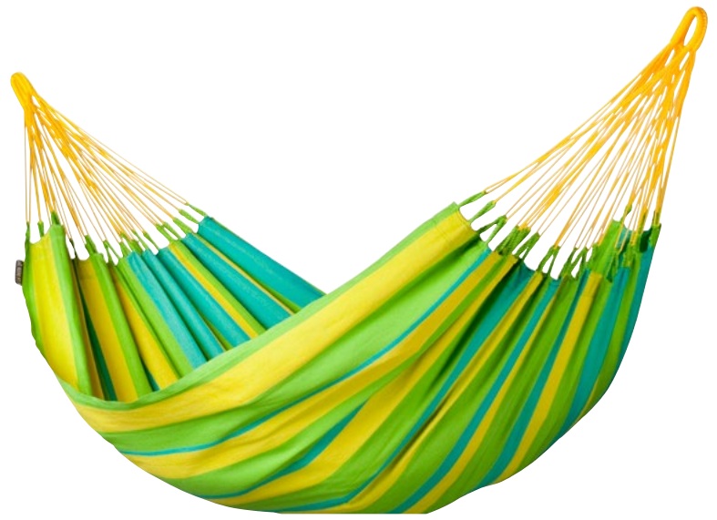
Single-Hängematte Sonrisa lime SNH14-4